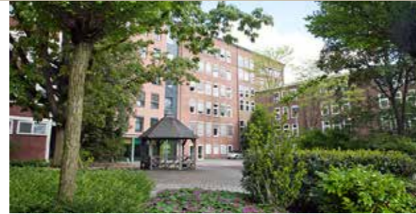
Schulgebäude an der Wiesenstraße