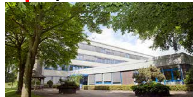
Schulgebäude an der Konrad-Adenauer-Straße